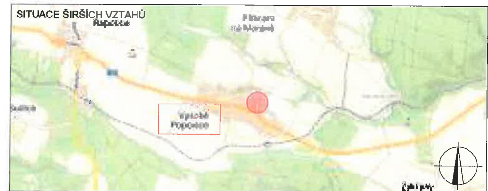
NÁVRH DOPRAVNĚ-INŽENÝRSKÉHO OPATŘENÍ PŘECHODNÉ ÚPRAVY PROVOZU

MĚSTSKÝ ÚŘAD ROSICE odbor dopravy 665 01 ROSICE