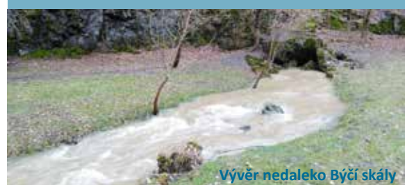
Vývěr nedaleko Býčí skály